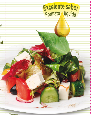
Sugerencia de presentación

Laboratorios Ordesa, S.L. C/ Coso Alto, 21 22002 Huesca (España)